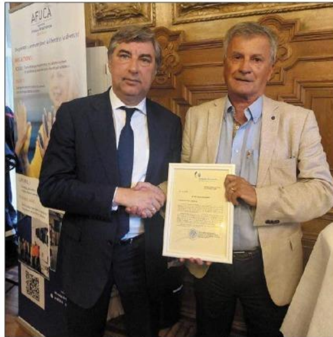
L'association Place Publique s'est vue remettre à Nice, par l'ambassadeur d'Ukraine en France, une lettre de remerciements signé du président Volodymyr Zelensky.